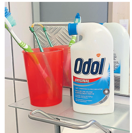
Seit 1892 auf dem Markt und ein durchschlagender Erfolg: das Mundwasser Odol.