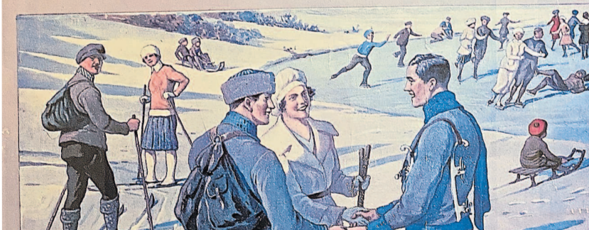
Diese Lehrtafel stammt aus den 1920er Jahren und wirbt für ausgewählte körperliche Ertüchtigungen und Enthaltensamkeit.

Bemühe Dich keusch zu bleiben ! Das beste Mittel dazu sind Leibesübungen. Sport und Spiel, Schwimmen und Wandern neben ernster Arbeit machen es Dir leicht, enthaltsam zu bleiben. Enthaltensamkeit ist nicht schädlich.