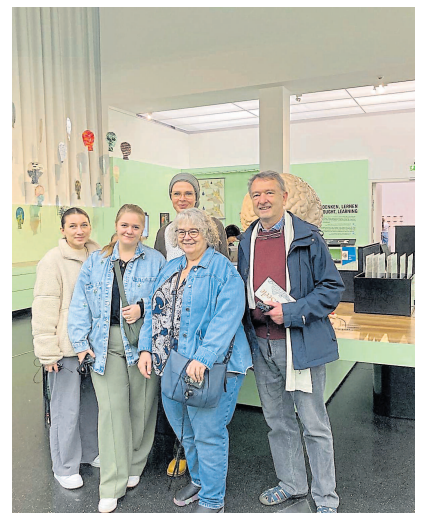
Besuch mit Mitgliedern des MuSeele-Vereins im Oktober des vorigen Jahres.

(Diplom-Psychologe und Leiter des Psychiatriemuseums MuSeele im Klinikum Christophsbad)